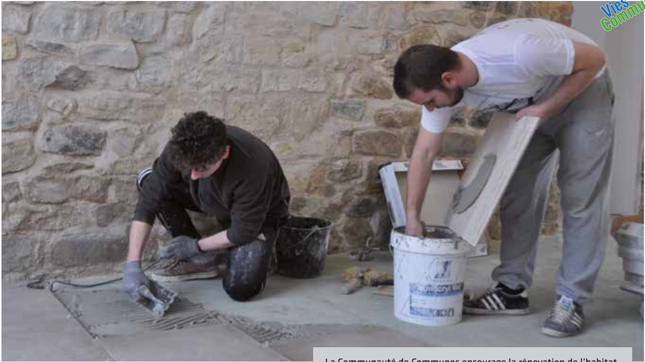
La Communauté de Communes encourage la rénovation de l'habitat.