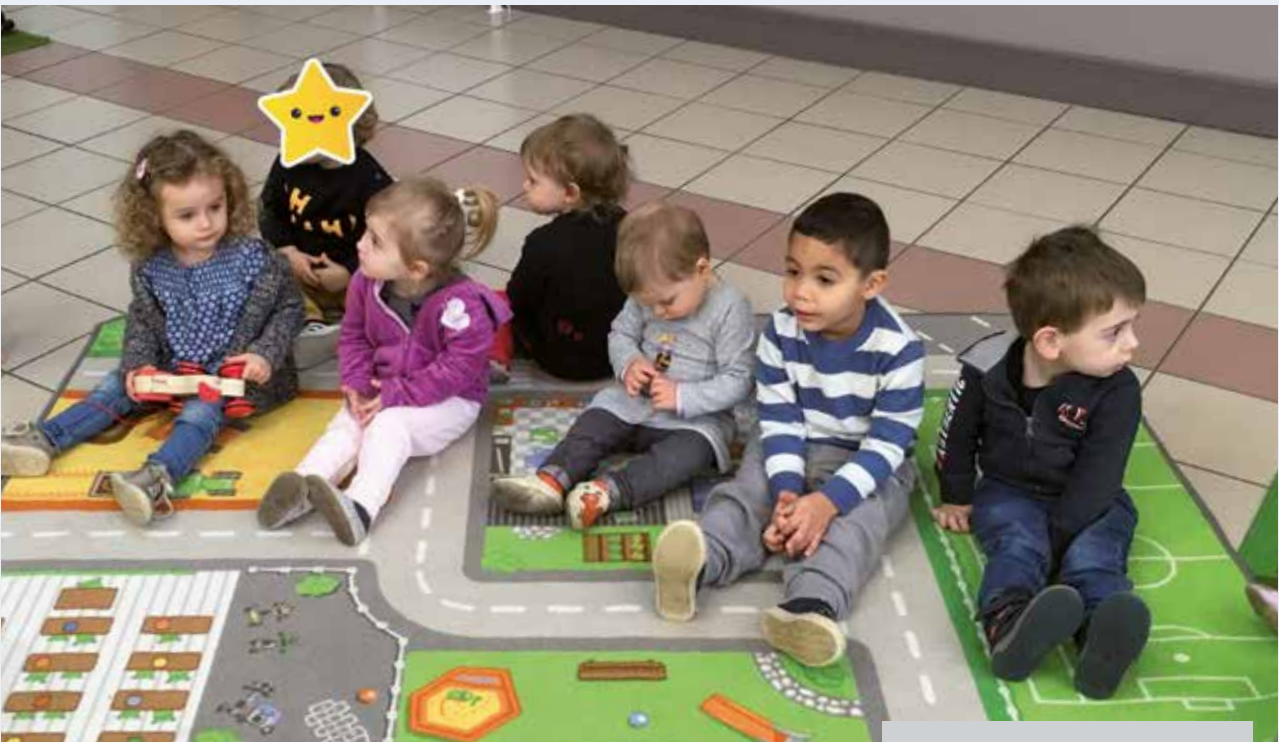
Un atelier délocalisé à Silly-sur-Nied.

Grâce à des réunions de réseau, de la veille documentaire et des rencontres professionnelles, les animatrices du RPAM font constamment évoluer leurs connaissances, pour assurer une qualité de service optimale.