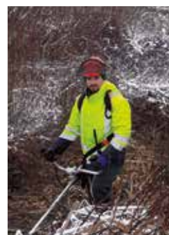
L'analyse de la qualité de l'eau traitée et rejetée dans la nature ainsi que l'entretien des ouvrages sont le quotidien du service.